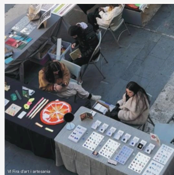
Vi Fira d'art i artesanía